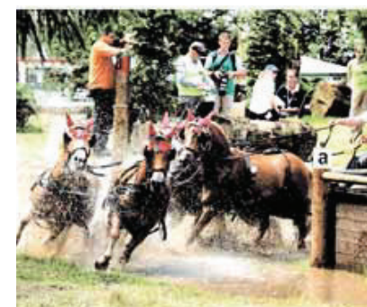
Fritz v. Santano