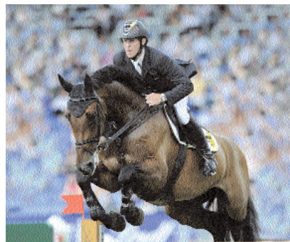
Noltes Küchengirl v. Lord Z