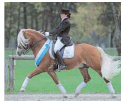
Stratus v. Steinach