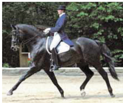
Lautrec v. Lord Sinclair