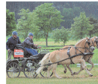
Nakuri v. Nebos II