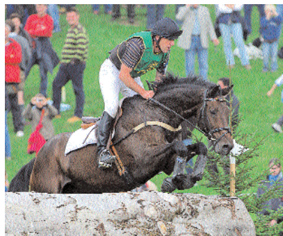
Killcross v. Lehnbach