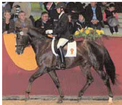
Done 3 v. Don Diamond

Auf den folgenden Seiten finden Sie die aktuellen Top Ten der Bayerischen Sportpferde, unterteilt in die verschiedenen Gruppen.