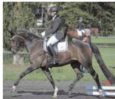
Maja v. Denario