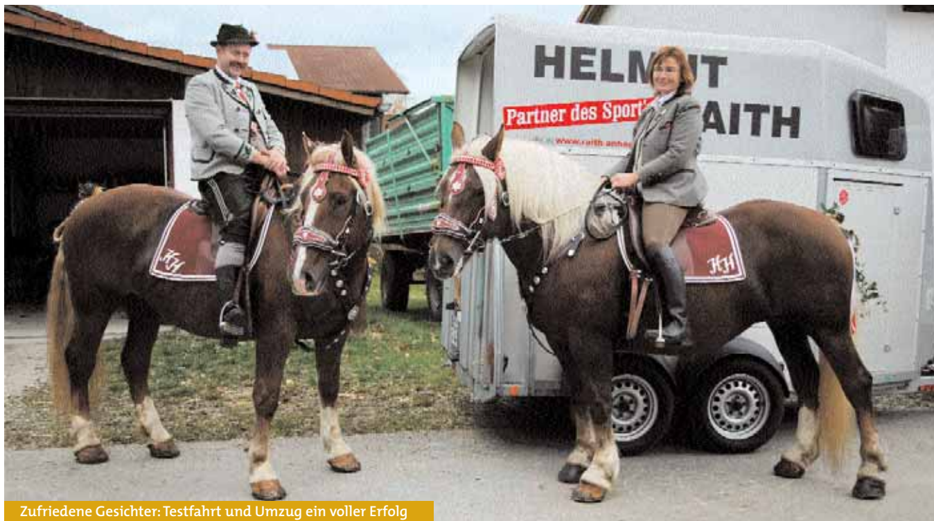
Zufriedene Gesichter: Testfahrt und Umzug ein voller Erfolg