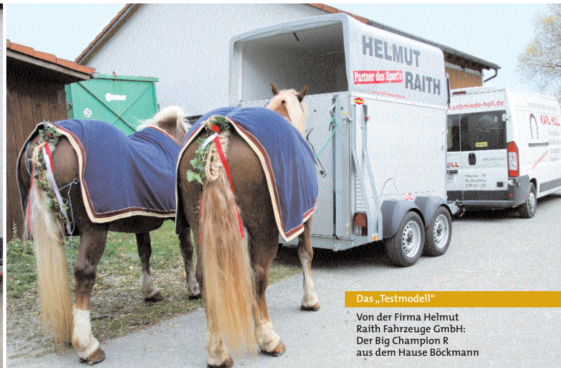
Das „Testmodell“ Von der Firma Helmut Raith Fahrzeuge GmbH: Der Big Champion R aus dem Hause Böckmann